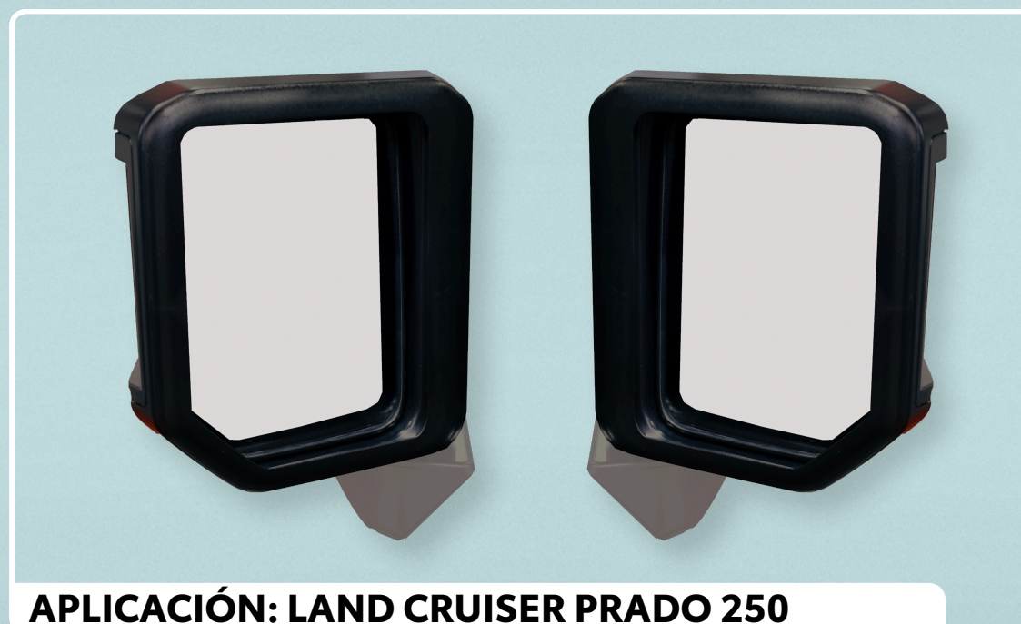
APLICACIÓN: LAND CRUISER PRADO 250