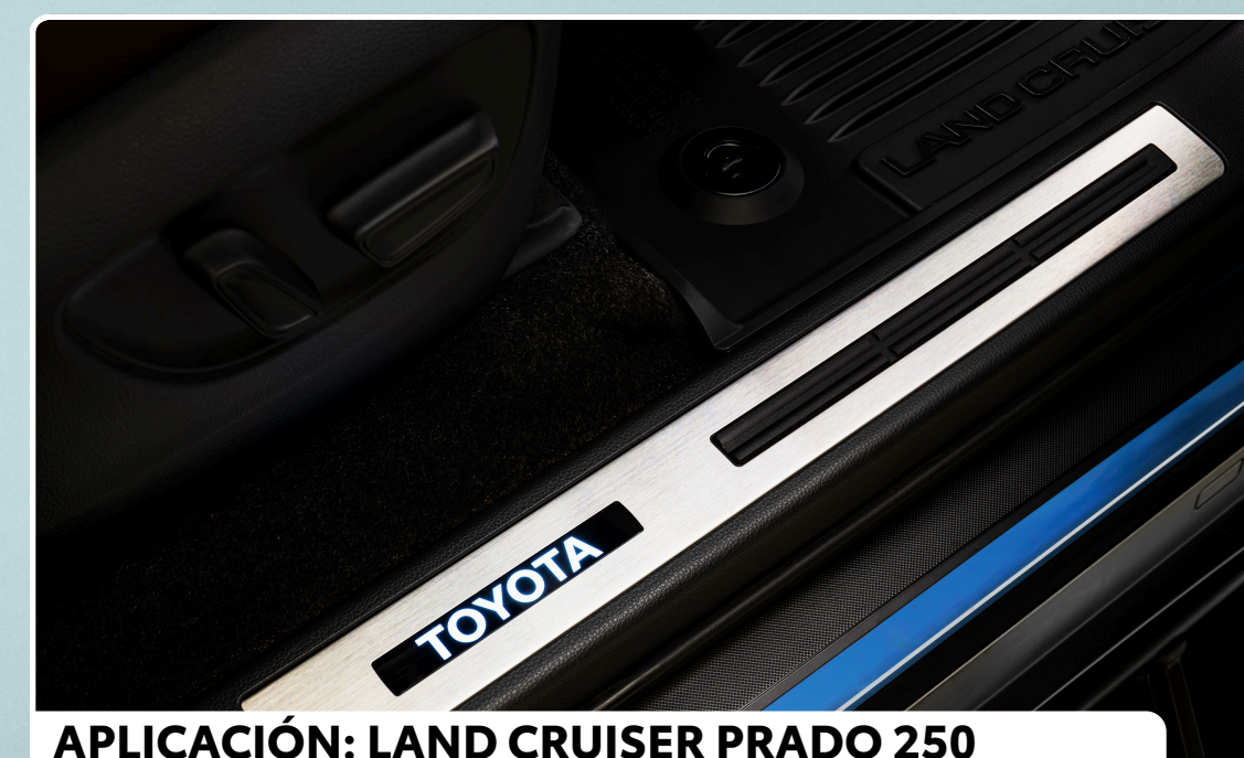
APLICACIÓN: LAND CRUISER PRADO 250