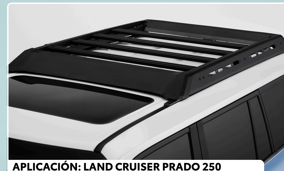
APLICACIÓN: LAND CRUISER PRADO 250