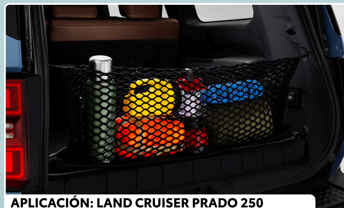
APLICACIÓN: LAND CRUISER PRADO 250