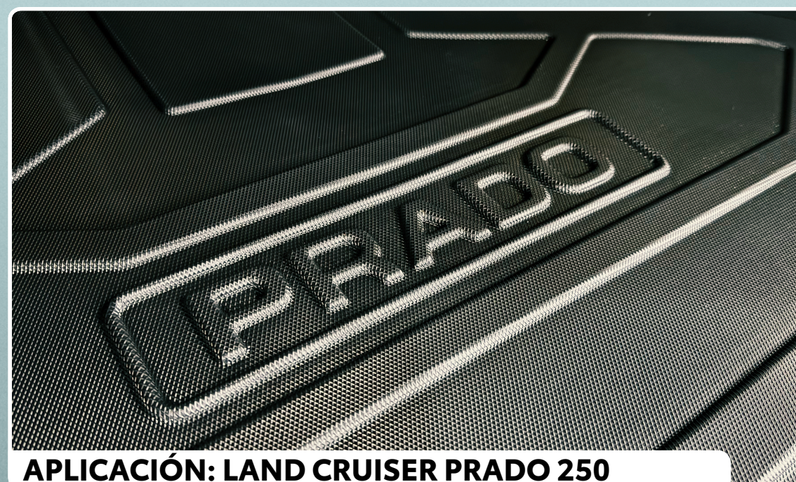
APLICACIÓN: LAND CRUISER PRADO 250