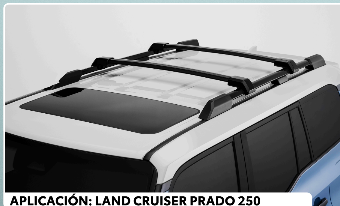
APLICACIÓN: LAND CRUISER PRADO 250