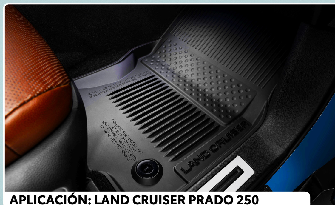
APLICACIÓN: LAND CRUISER PRADO 250