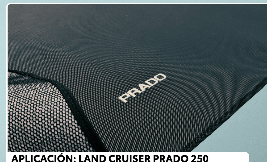
APLICACIÓN: LAND CRUISER PRADO 250